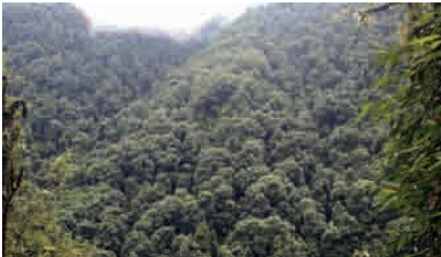
Oak forests with middle storey of dwarf bamboo

Sikkim has been known to be the most humid region in the whole range of Himalaya, because of its proximity to the Bay of Bengal and direct exposure to the south-west monsoon. The annual rainfall ranges from 200 - 500 cm in most of its inner valleys except for its northern most region which receives scanty rainfall. Throughout the year, but particularly from June to September, monsoon brings heavy rainfall to the state. Lower hills and valleys enjoy a sub tropical climate, warm in winter, hot and extremely humid in summer. Towards interior the climate becomes gradually more temperate