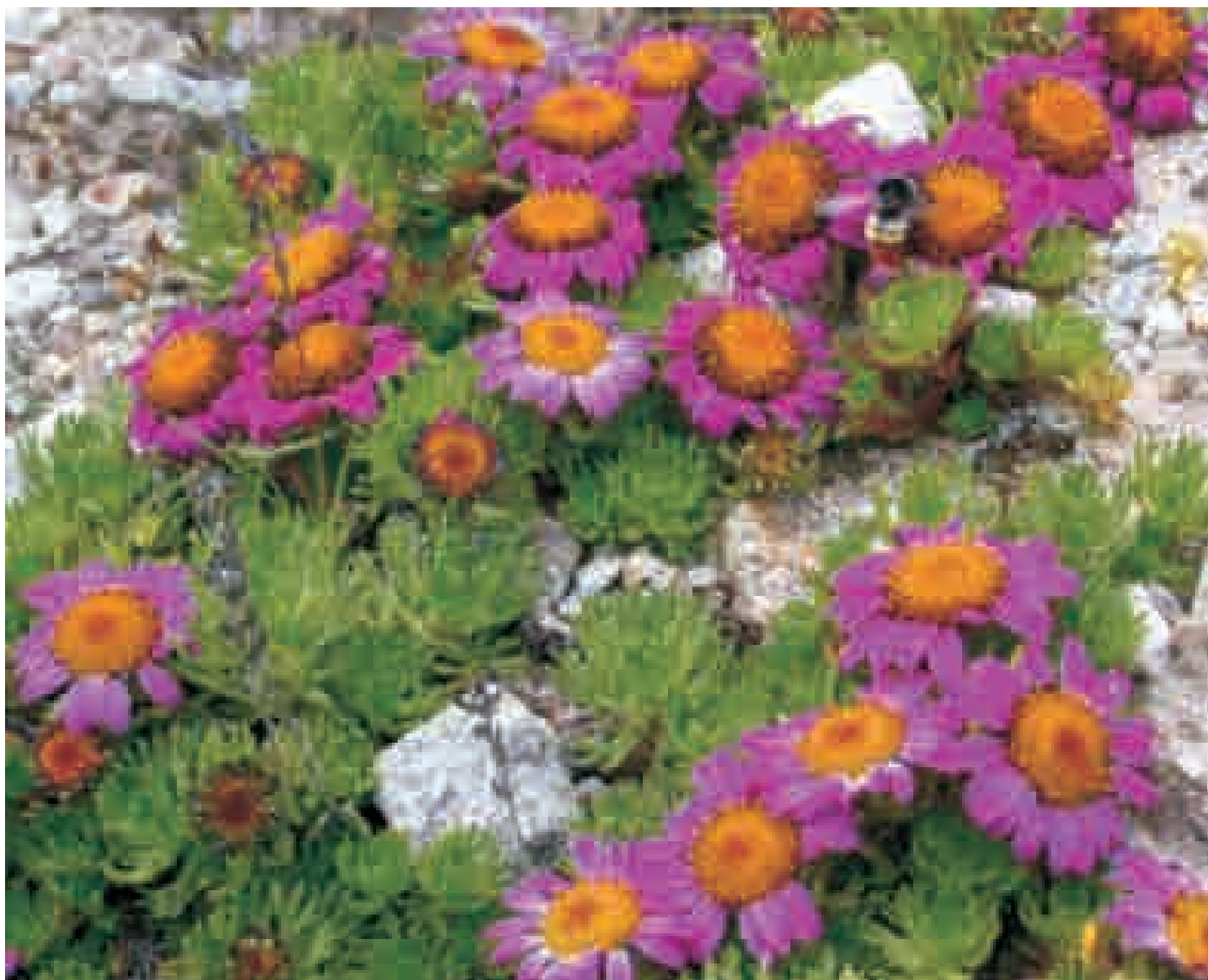
Waldheimia glabra in Lhonak, North Sikkim

KEYWORDS: Diversity, Dominant genera, Endemics, Families, Flowering Plants, Sikkim