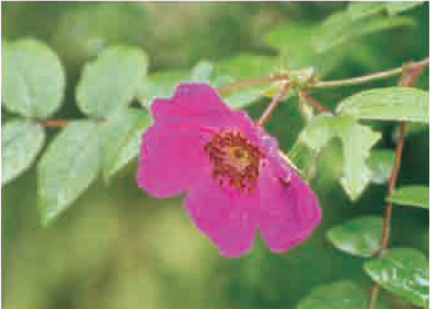
Rosa macrophylla - alpine wild rose