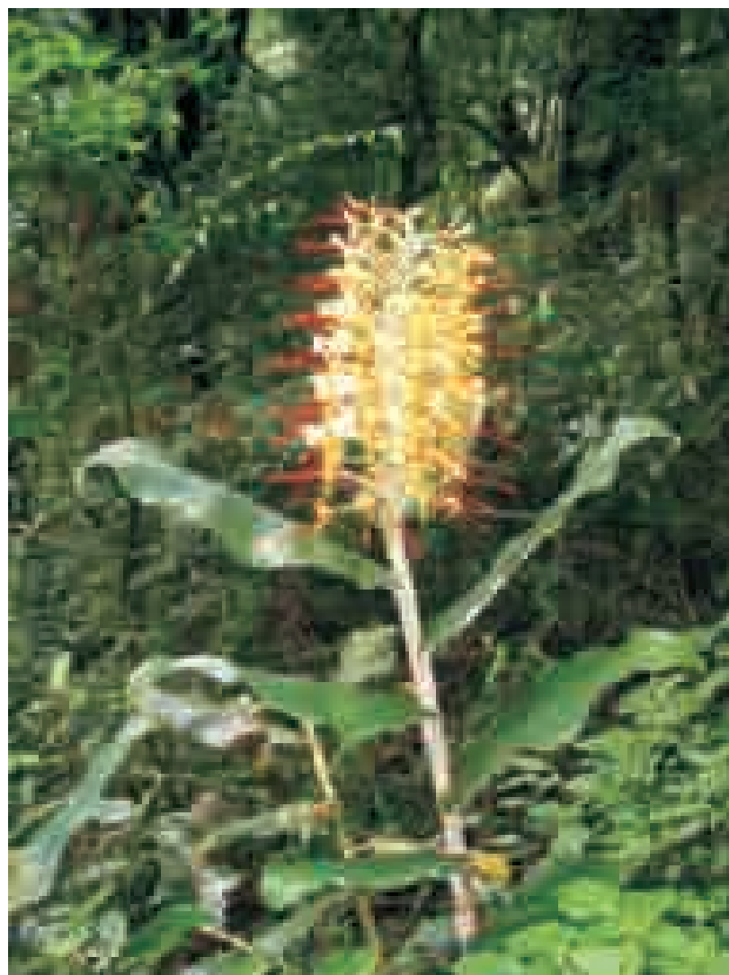
Hedychium gardnerianum - a plant native to the Himalaya