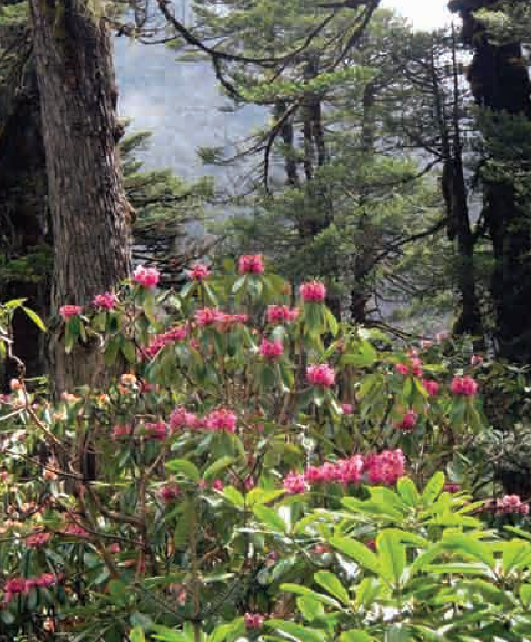
Middle storey of Rhododendron in Conifer forests