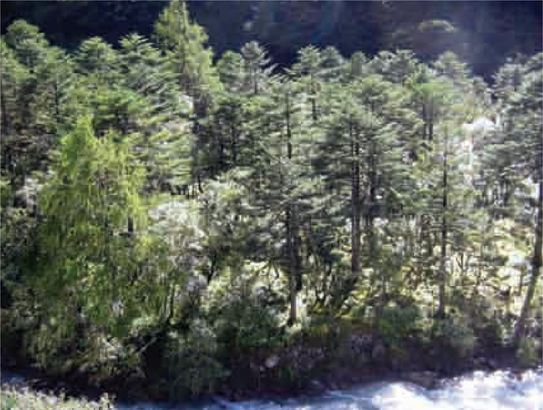
Subalpine conifer forest in North Sikkim

with cool winters and hot summers and often heavy rainfall. In northern part of the state the summers are short and cool, and winters with considerable snowfall and frost.