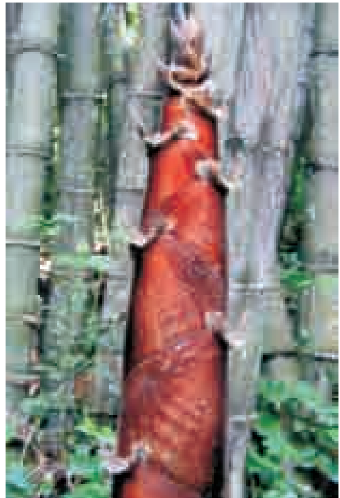
Culm of giant bamboo - Dendrocalamus sikkimensis , locally known as Bhalu Bans